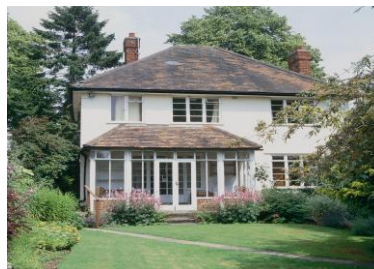
Alojamiento en campus