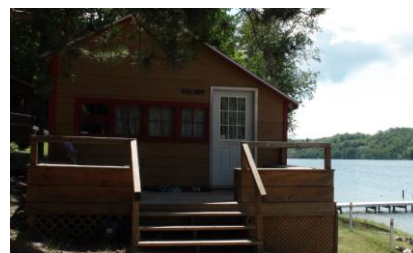
Vista de las cabinas de alojamiento